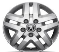
16" Легкосплавный диск (DZ86 - только для версий 435 и 440)