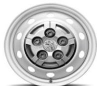
15" Стальной диск