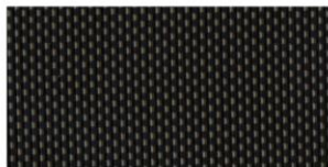
Ткань черная RYFH (код опции OPRY)