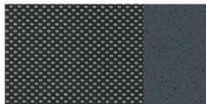
Искусственная кожа серая TJFZ (код опции OPTJ)