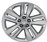
Литые алюминиевые диски 17" PHOENIX