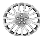
Колпаки штампованных стальных дисков 17" MIAMI