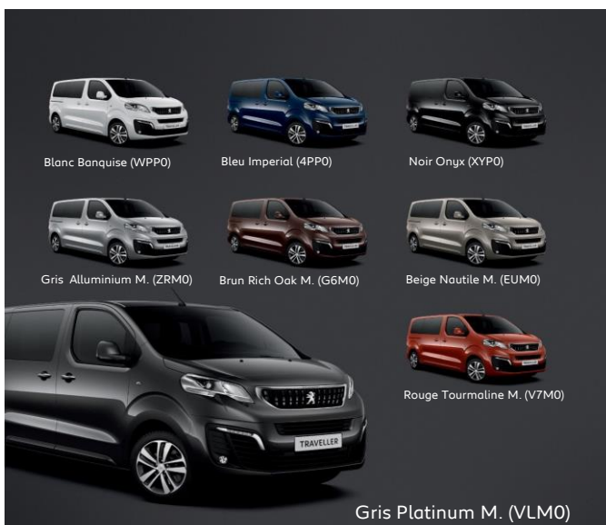
Blanc Banquise (WPP0)