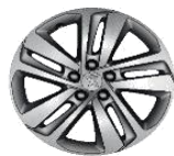
Литые алюминиевые диски 17" BLACK PHOENIX